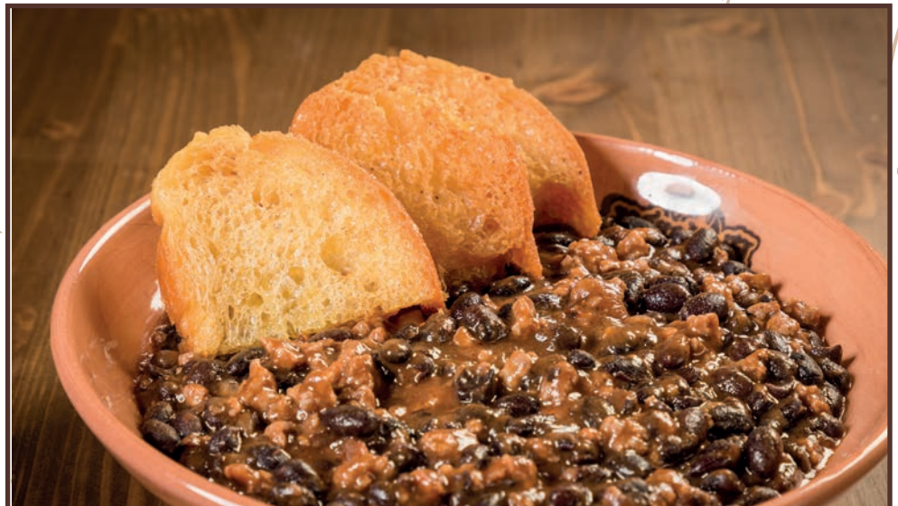
(225) Mexican red hot 🍌

Minimo 800gr , frollatura minima 21giorni all' 6.50 etto