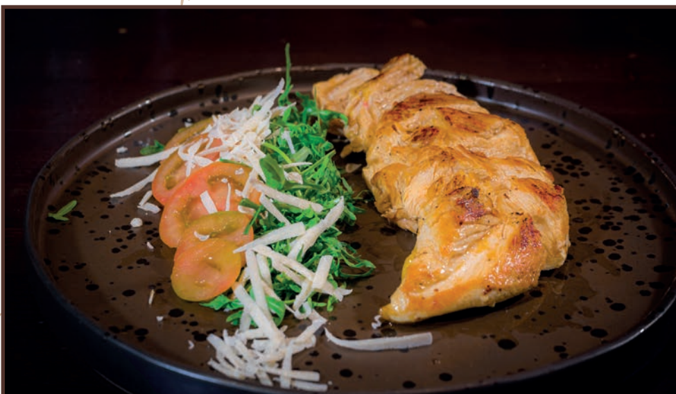
(227) Tagliata di pollo

Entrecote irlandese 300 gr (indicare cottura) 15.00